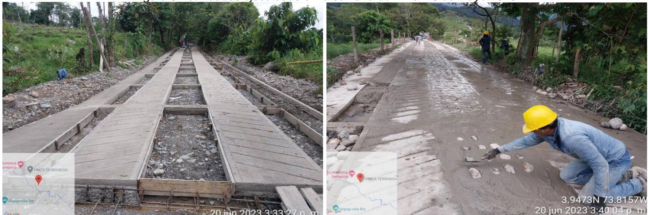
Figura 3 Actividades ejecutadas en la semana del 12 al 18 de mayo 2023

El 20 de junio termina el contrato de interventoría, quedando pendientes actividades que se encuentran consignadas en acta de entrega.