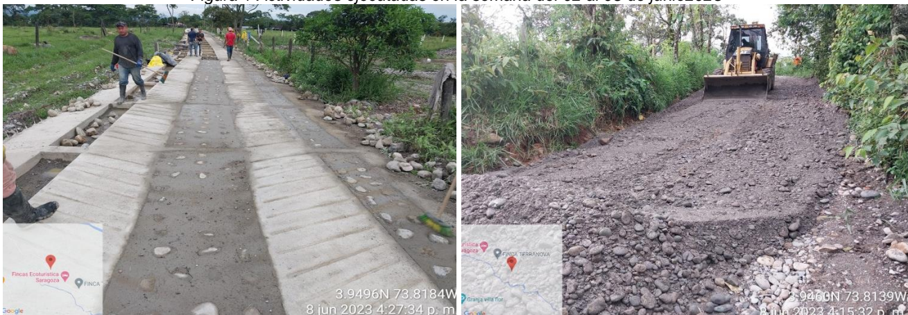
Figura 1 Actividades ejecutadas en la semana del 02 al 08 de junio 2023

Durante esta semana del 09 al 15 de junio de 2023: